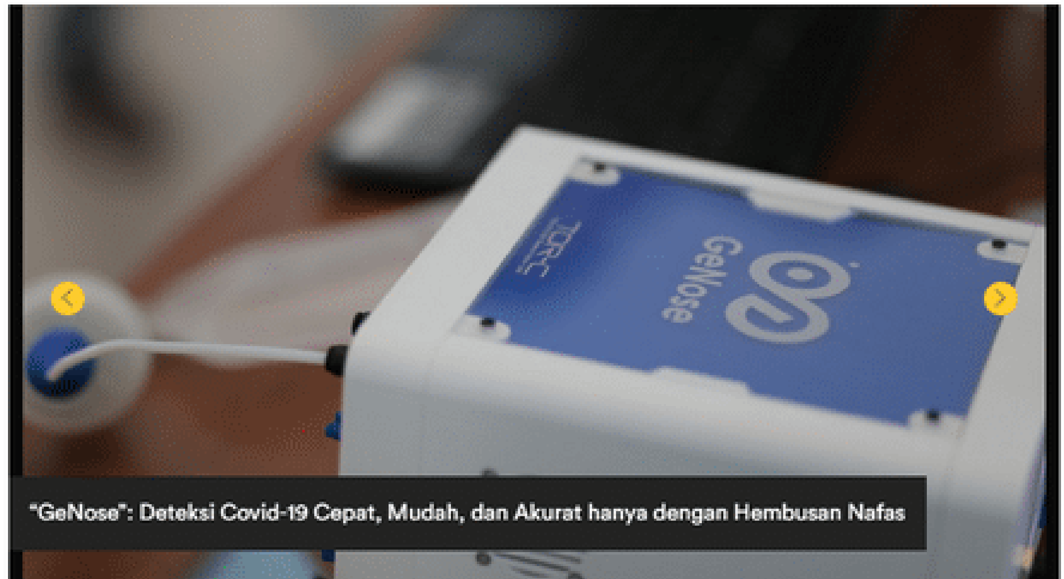
"GeNose": Deteksi Covid-19 Cepat, Mudah, dan Akurat hanya dengan Hembusan Nafas